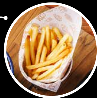
Papas a la francesa