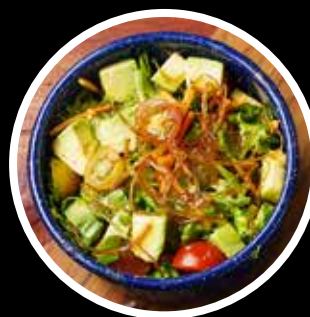
Rica y fresca ensalada

Nuestro costichicharrón es elaborado con cocción lenta siguiendo una receta original de la casa. Asado a la perfección en parrilla o Josper, según el punto de venta, para ofrecerte un sabor único y jugoso. Acompañado de ensalada fresca y papas a la francesa, ¡una verdadera delicia!